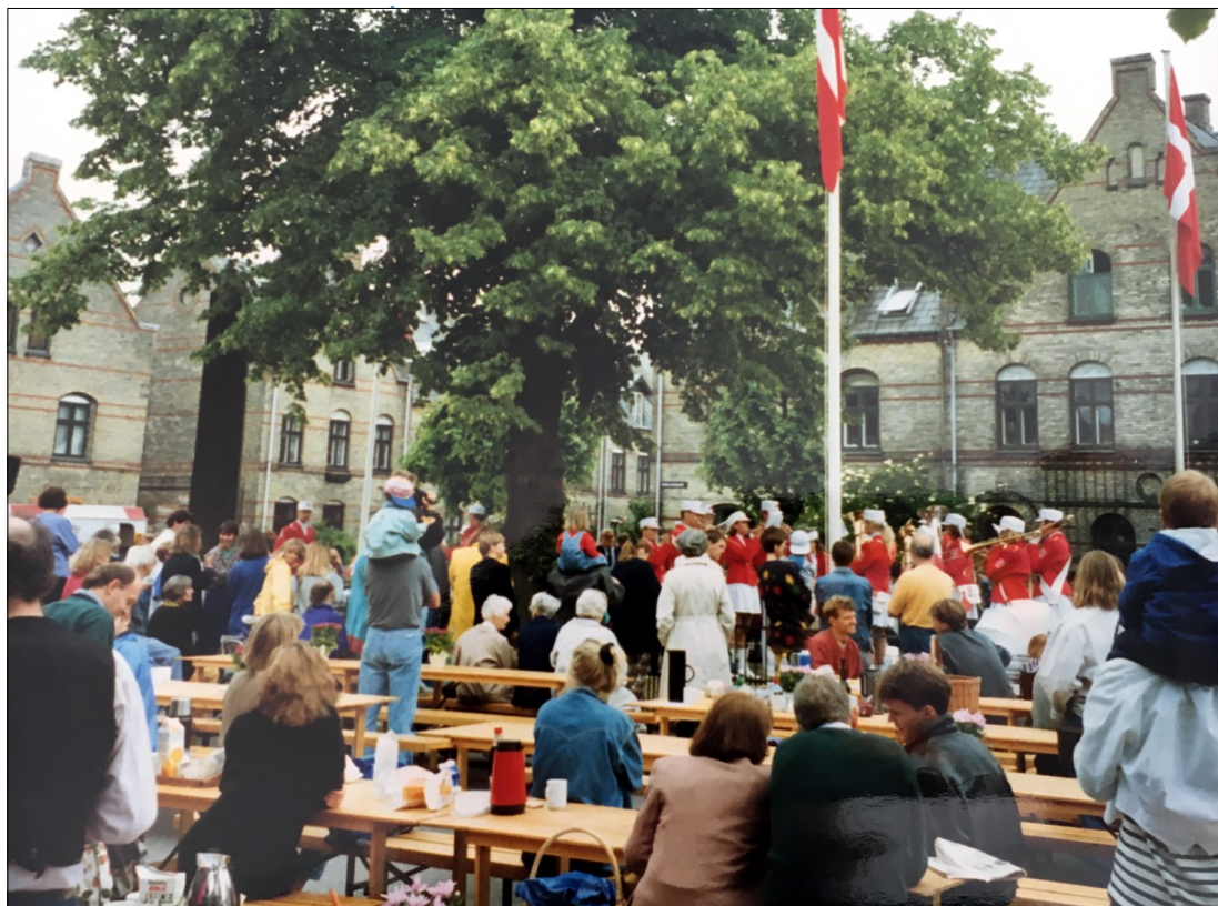
Foto fra kvarterets 100 års jubilæet 1993