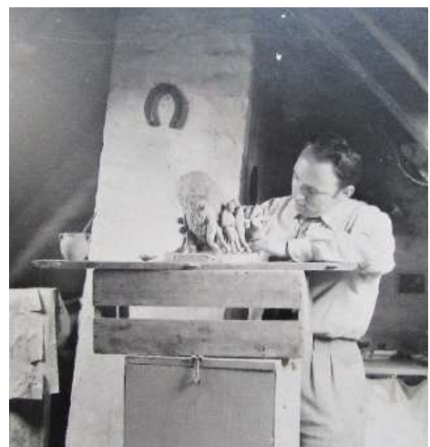
Min far arbejder på loftet