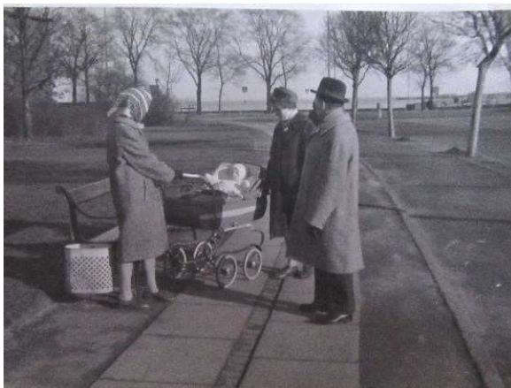
Forårstur til Svanemøllebugten

Den gang var der ikke badestrand og heller ingen Nordhavsvej. Til gengæld eksisterede Tuborg bryggeriet i Hellerup, og man kunne se store bjerge af ølkasser bag hegnet for enden af strandpromenaden. Når vinden var i nord, kunne man også tydeligt lugte bryggeriet.