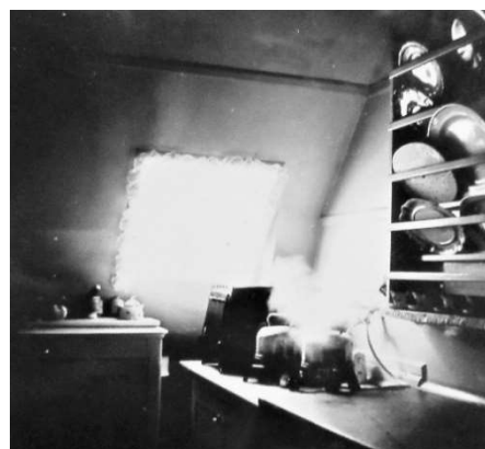
Køkkenet på 2. sal i 1950'erne

Jeg boede i huset fra mit første år i 1964 til jeg flyttede til udlandet i 1993. I mine sidste år i huset var min farmor flyttet til en ældrebolig på Nørrebro i nærheden af De Gamles By og jeg overtog lejligheden på 2. sal. Det var meget fint, men ikke særlig moderne. Der var det originale køkken – dog med gasapparater i stedet for brændekomfur. Der var ikke indlagt varmt vand, så vand til opvask mv. blev varmet i en kedel på gasapparatet.