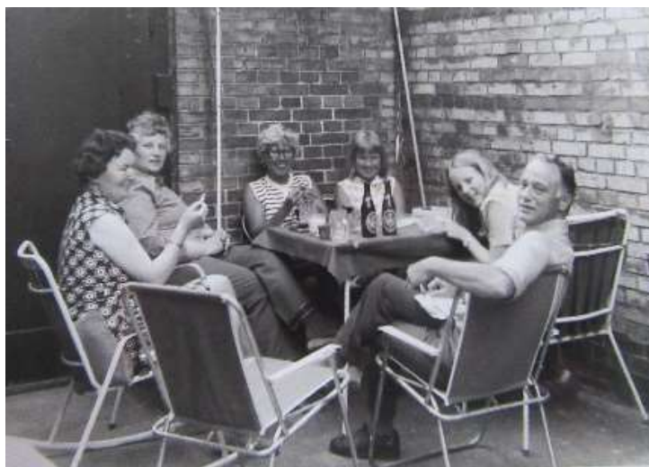
Familiebesøg i gården

Vi holdt ofte til i gården om sommeren, som var blevet indrettet rigtig hyggeligt. Her var der mulighed for lidt mere privatliv end i haven ud mod Heisesgade.