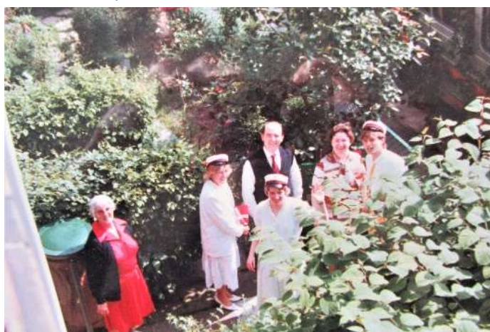
Nebraskas billede af studenterne

bævermor med ind og mine klassekammerater troede, at det var min mormor.