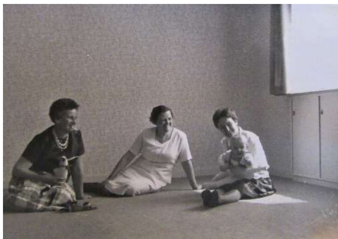
Lejligheden i stueetagen klar til indflytning med skabe i vinduesnicherne

Huset havde de originale vinduer, som ofte skulle males for ikke at forfalde. Der var ikke tale om termoruder, så der var ofte køligt i stuerne om vinteren. På et tidspunkt fik vi opsat forsatsvinduer, og det hjalp gevaldigt.