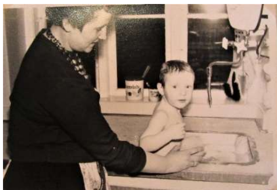
Bad i køkkenvasken - gasvandvarmer

Alternativet var dog inden for rækkevidde, da det var muligt at besøge badeanstalten under Østerbro Svømmehal. Her kostede et brusebad 2 kr. og et karbad 4 kr. Man havde adgang til badekabinen i en hel time for det nævnte beløb.