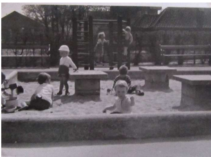
Legepladsen på Østerbrogade ved den nuværende Svanemøllen station

Der var et stort kastanjetræ ved legepladsen, som jeg altid holdt øje med, da min mor gav is, når kastanjetræet blomstrede – eller som hun sagde – når der kommer lys på kastanjen. Træet står der endnu, men både legepladsen og min mor er væk.