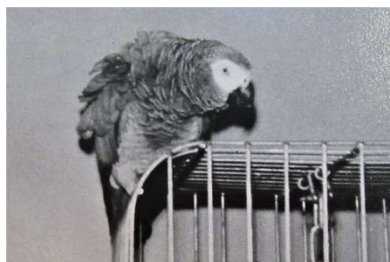
Ingers papegøje Stumpe

Min mor havde også en papegøje, som holdt meget af noget særligt foder med melasse, som kunne købes i en fugleforretning på Australiensvej. Det gav mig mange cykelture til Australiensvej.