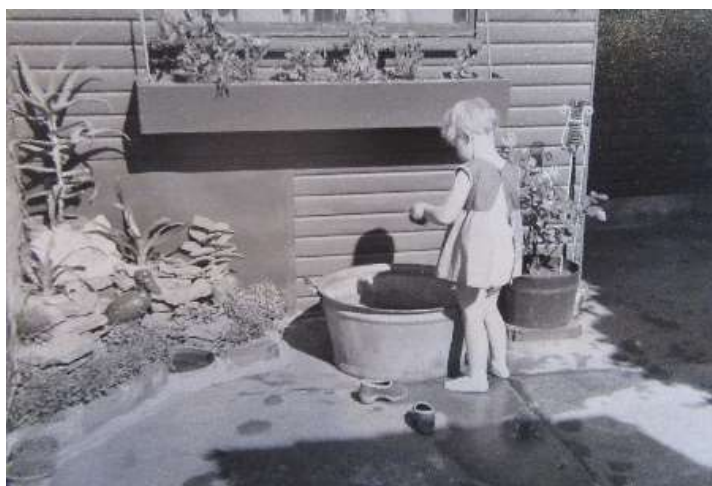
Det lille anlæg med træskonæb

Vi havde et lille cykelskur og redskabsrum i gården og min far indrettede et lille anlæg med fuglebad. Hans skulptur af fuglen "træskonæb" prydede det lille anlæg. Nu bor "træskonæb" hos mig og pryder min vindueskarm i stuen.