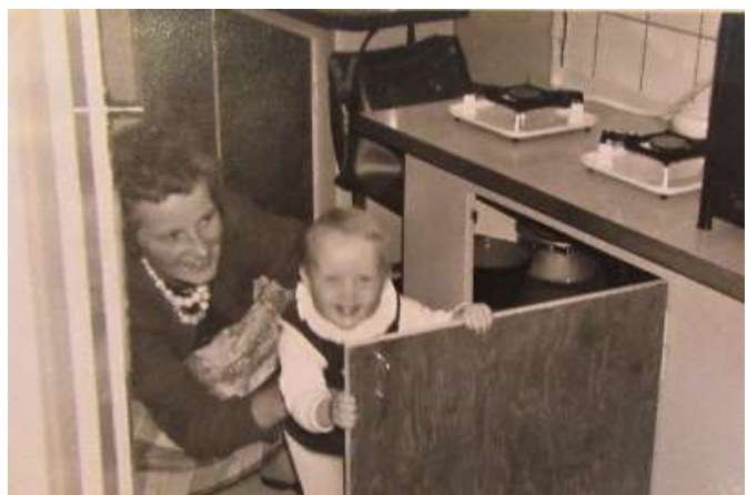
Køkkenet på 1. sal med gasbordet

I de første år var der bade faciliteter i huset. De bestod af et stort badekar i kælderen og en gammeldags gruekedel, hvor der blev varmet vand med brænde og gamle aviser. Vandet blev flyttet fra gruekedlen til badekarret med en kande. Det var således en proces, som krævede en del forberedelse og tid, hvorfor badekarret sjældent blev brugt. Når det skete, at der blev fyret op i gruekedlen, spredte der sig en ubehagelig lugt på trappen. Der var ingen udsugning fra det kælderrum, hvor gruekedlen stod ud over et lille kældervindue.