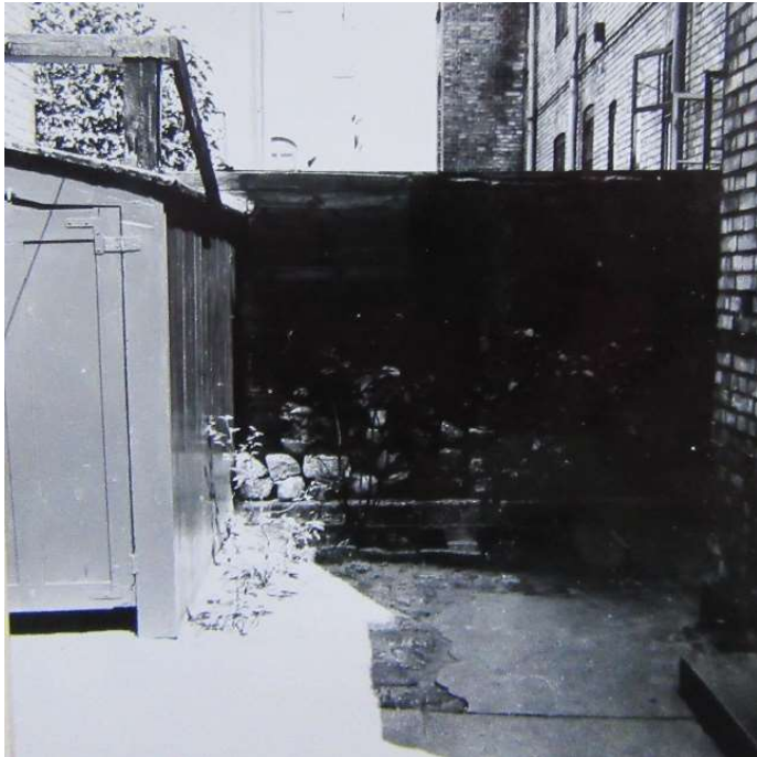
Det gamle das i gården i 1950'erne

Husets sanitære forhold var meget primitive i de første år. Der var et enkelt toilet i stueetagen, som hele familien benyttede. Efter nogle år blev der bygget to yderligere toiletter.