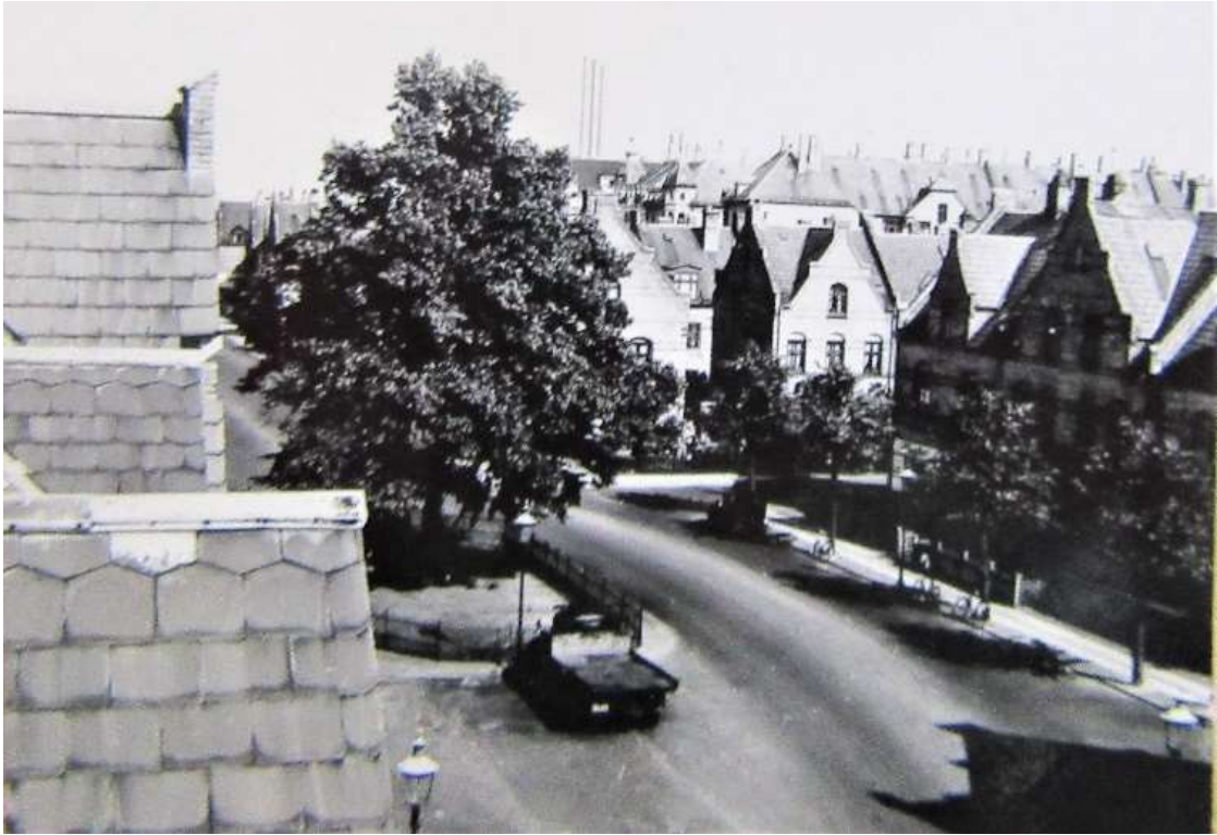
Udsigt fra loftet med gaslamper på Torvet

Loftet var tilgængeligt via en snoet og lidt farlig trappe. Der var en fin udsigt fra loftet over torvet og på en klar aften kunne man se lidt af fyrværkeriet fra Tivoli. Da jeg var lille og familiens midtpunkt, satte farmor en tallerken med risengrød på trappen til loftet i december måned. Den var tiltænkt nissen, som boede på loftet og det varede en del år før det gik op for mig, at farmor selv spiste grøden.