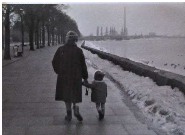
Strandpromenaden en vinterdag

I min barndom hørte jeg ofte sagt "skal vi ikke slå et slag ned til vandet" hvilket var en opfordring til at gå en tur til Svanemøllebugten.