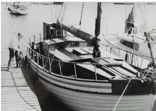
Båden "Agnes" i lystbådehavnen