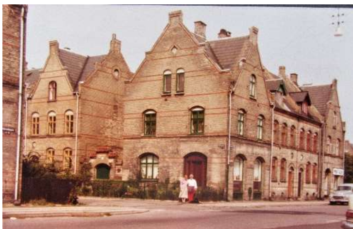
Vores hus, hvor man kan se møntvaskeriet i baggrunden