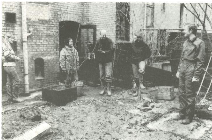
Beboerne under arbejdet

Vores udsendte medarbejder har været inviteret indenfor i baggården til weysesgade nr. 4. Vi har fotograferet gårdene under selve rydningen, og efter at der er sket græsplane og plantet små nye træer. Der er kørt en stor containerfuld betonbrokker m.v. bort, der er nærevet nogle plankeværker - og beboerne i et par nabohuse har tillbragt nogle anstrengende (og fornøjelige) timer sammen. Fordelene ved en sådan gardrydning er mere lys og luft blandt husene - og små, indeklemte gårde kommer pludselig til at danne en meget større havelignende opholdsplads. Kilden vil vende tilbage til nr. 4 i et senere nummer af bladet, hvor vi forhåbentlig vil kunne bringe billeder fra det færdige anlæg.