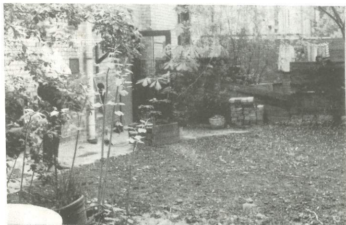
Gården en måned senere