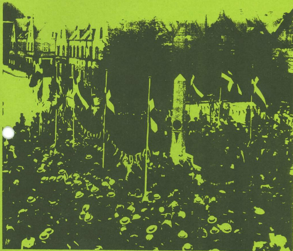
Indvielsen af obelirken på torvet, 14. juli 1916.

Foreningens 100 - års Jubilæum, - Historisk udvalg