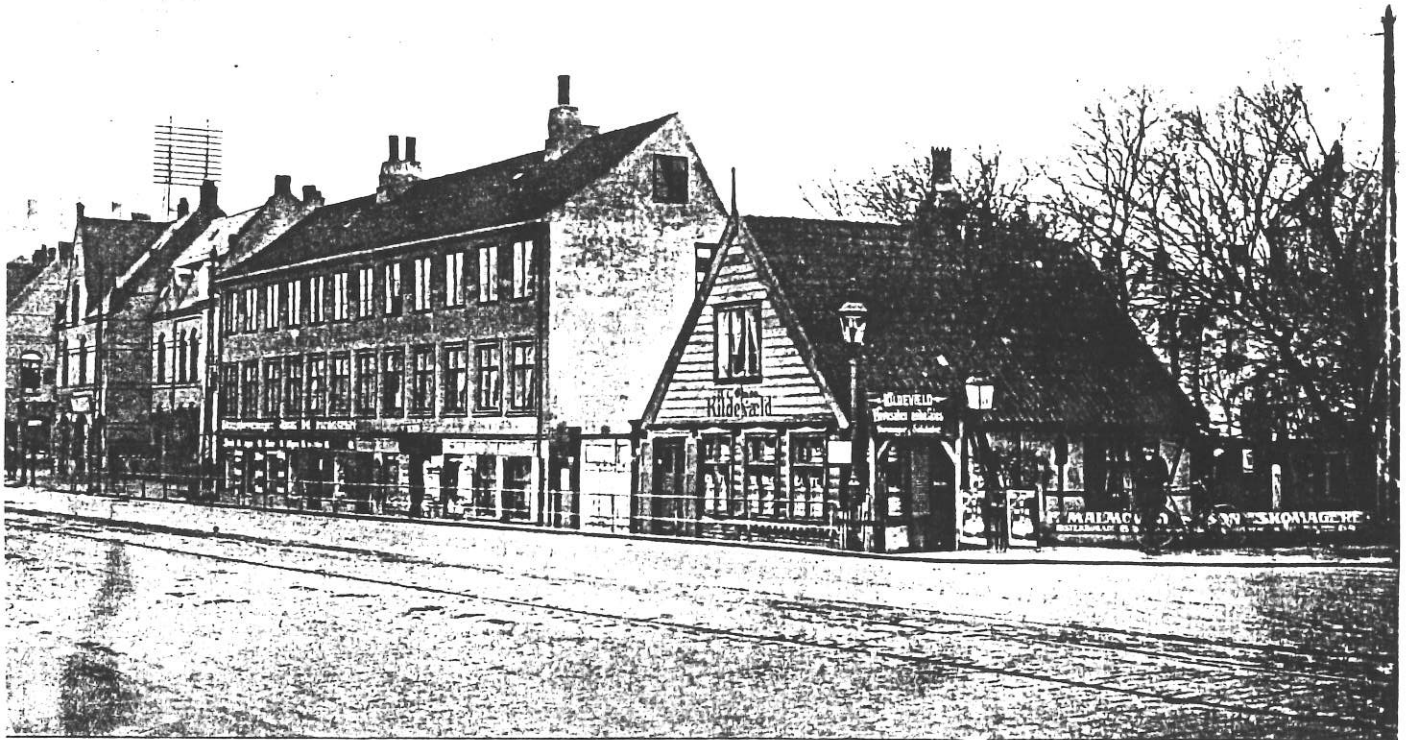
Ejendommen „Kildevæld“, nu Nr. 49 og 49 A paa Strandvejen, respektive Matr. Nr. 916 og 917.