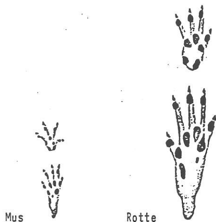
Fodspor, naturlig størrelse

Man kan også ud fra fodspor i støv, talkum eller mel, som man har drysset ud, hvor de færdes, mange få afgjort sagen.