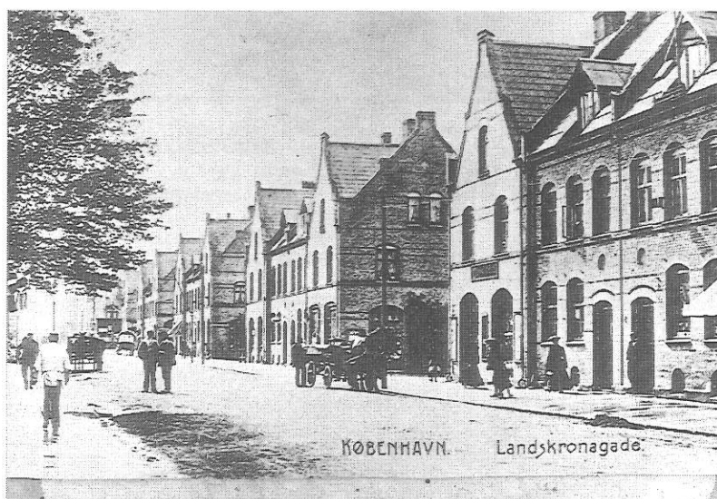
Landskronagade ca. 1915