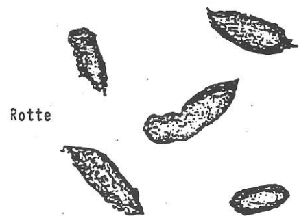
Ekskrementer i naturlig størrelse

Støj fra loftet kan også komme fra en husmår. Hører man kraftig gnaven og især hvin og skrig der oppefra, er der dog ingen tvivl om, at det drejer sig om rotter. Hvis man kigger efter på loftet, vil man, hvis det drejer sig om husmår, ofte finde rester af fugle og andre byttedyr og eventuelt mårens ekskrementer, som er sorte og snoede. De er op til 8-10 cm lange og ca. 1 cm tykke, og derfor slet ikke til at forveksle med rottens.