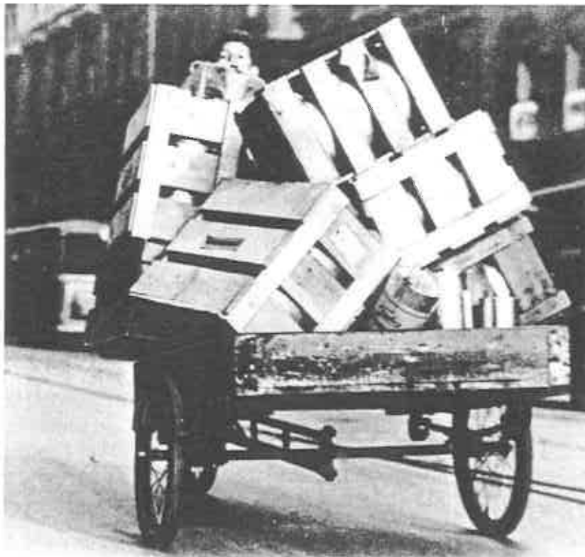
Med fuldt læs.

MEN: Flere - især ældre og svagtseende - har fortalt, at de er faldet over cyklerne, fordi de har været parkeret på fortovene og ved gadetræerne. Derfor henstiller vi fra bestyrelsen og de implicerede tilskadekomne om, at Christianiacyklen parkeres i forhaverne og ikke på fortovet eller ved kantstenen.