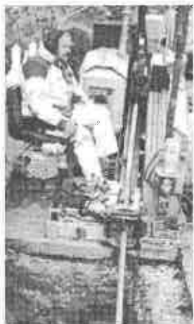
Jan styre boremaskinen til den styrede underboring.

Hullet bores med et langt jernrør, som successivt udvides med rørstykker på 1,8 meter. Man borer et hul på ca 110 meter, svarende til ca halvdelen af Berggreensgades længde.