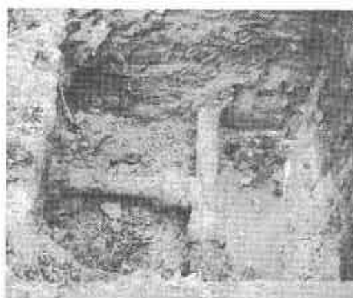
De gamle støbejernsrør under fortovet ved stikledningen ind til et hus.

hele, så de kun sjældent kommer til at lave skade på de andre systemer. KE står hos os for gas, vand, el, afløb og fjernvarme.