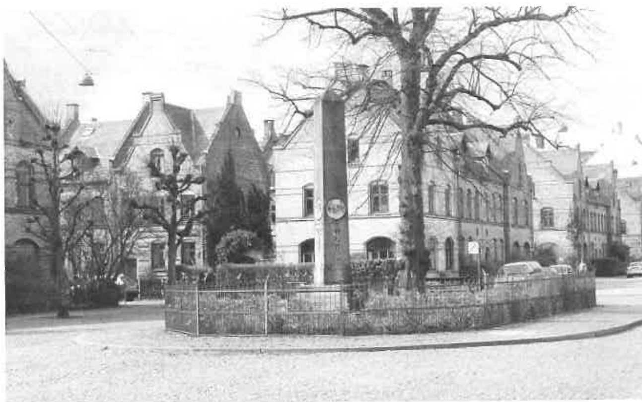
Det smukke Kildevældstorv, som i over 120 år har været kvarterets samlingssted