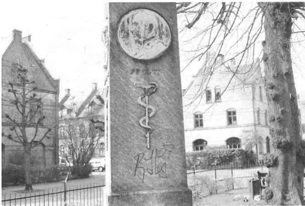
Obeliskens år 2008.

Paa Alderdoms Hygge skal i Ungdom du bygge