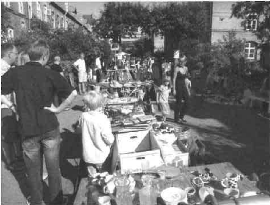
Trængsler omkring boderne. Der var alle stede et mylder af folk.

Og til trods for, at popikonet George Michael holdt afslutningskoncert i Parken samme aften, var der vild gang i festen bagefter. Først fællesgrill. Foreningen havde endnu en gang varmet op under de kvadratmeter store griller – i år var der to, da der var meget trængsel sidste år. Bøffer og pølser i fælles forening. Succesen med gratis fadøl blev gentaget fra sidste år. Hvilken luksus, og hvilket herligt mødested omkring anlægget. Bagefter var der dans. Basement Band spillede og sang dansepops og rock, så hverken unger eller voksne kunne sidde stille. En dansefest af dimensioner.