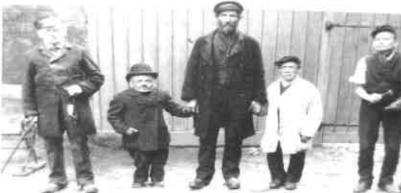
En sommerhilsen fra den hårdtarbejdende bestyrelse