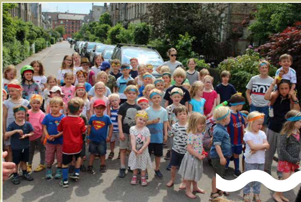
Børnenes dag 27. maj 2018.