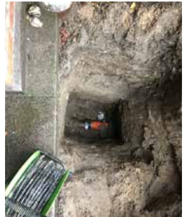
Udbedring af brud på kloakrøret i 2,7 meter nede.