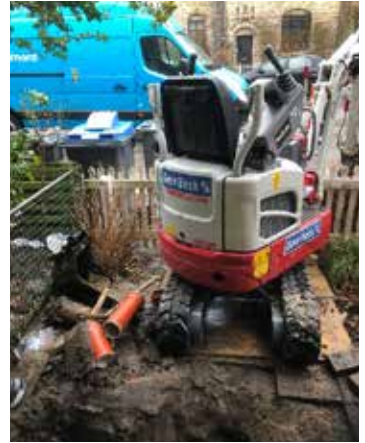
Udgravningsarbejde Kildevældsgade 9

Ved sætning af røret, sker der det, at vandet baner sin egen vej uden for langs kloakrøret, frem til den næste svage sætning i kloakrøret. Det skete ved i bunden af vores store kloak (se billedet nedenfor). Der er derfor to skader på i kloakløbet der skal udbedres.