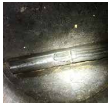
Udbedring af brud på kloakrøret i 2,7 meter nede.