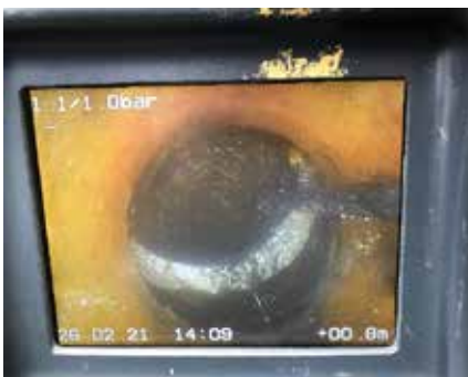
Sætning af kloakrøret under huset